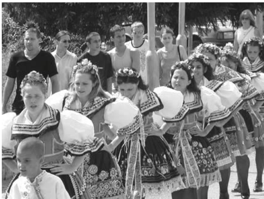
Fotografií stárek si připomínáme letošní mladé hody.