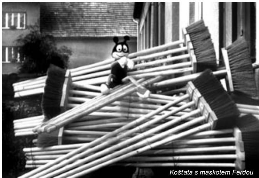
Košata s maskem Ferdou