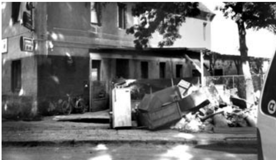
Zničené vybavení domácností. Voda sahala až nad okna, jak je vidět podle tmavého pruhu.