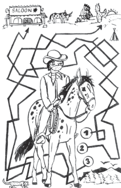
ZJISTI, KTERÁ CESTA KAM DOVEDE ZBLUDILÉHO DESPERÁTA.