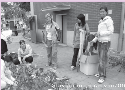
Stavění máje červen/09