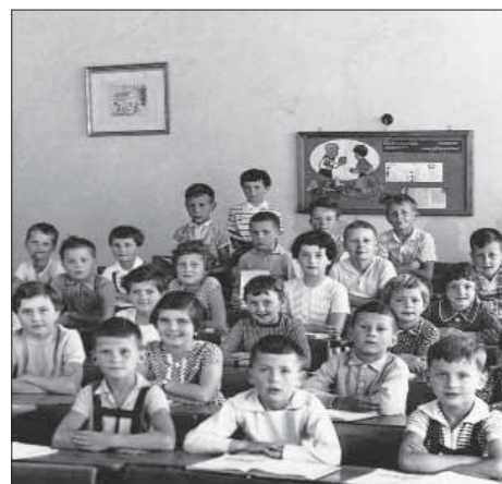
Seznam ředitelů a ředitelky:

Roku 1986 byla ve dvoře postavena školní jídelna. Vznikl tak ucelený školní areál, který je neustále dobudován tak, aby sloužil potřebám dětí. V roce 1999 byla jedna třída v původní školní budově přebudována na poštovní středisko. Škola nabízí dětem klidné, ale podnětné prostředí ke vzdělávání. Na škole pracuje řada kroužků, školní družina a škola poskytuje prostory pro hudební a výtvarnou výuku. Základní umělecké školy Střelice. Od ledna r. 2003 se všechny základní a mateřské školy, které do té doby byly organizačními složkami obcí, staly samostatnými právními subjekty. Mateřská škola v Ostopovicích se z praktických důvodů stala součástí základní školy a vznikla příspěvková organizace Mateřská škola a Základní škola Ostopovice, okres Brno-venkov.