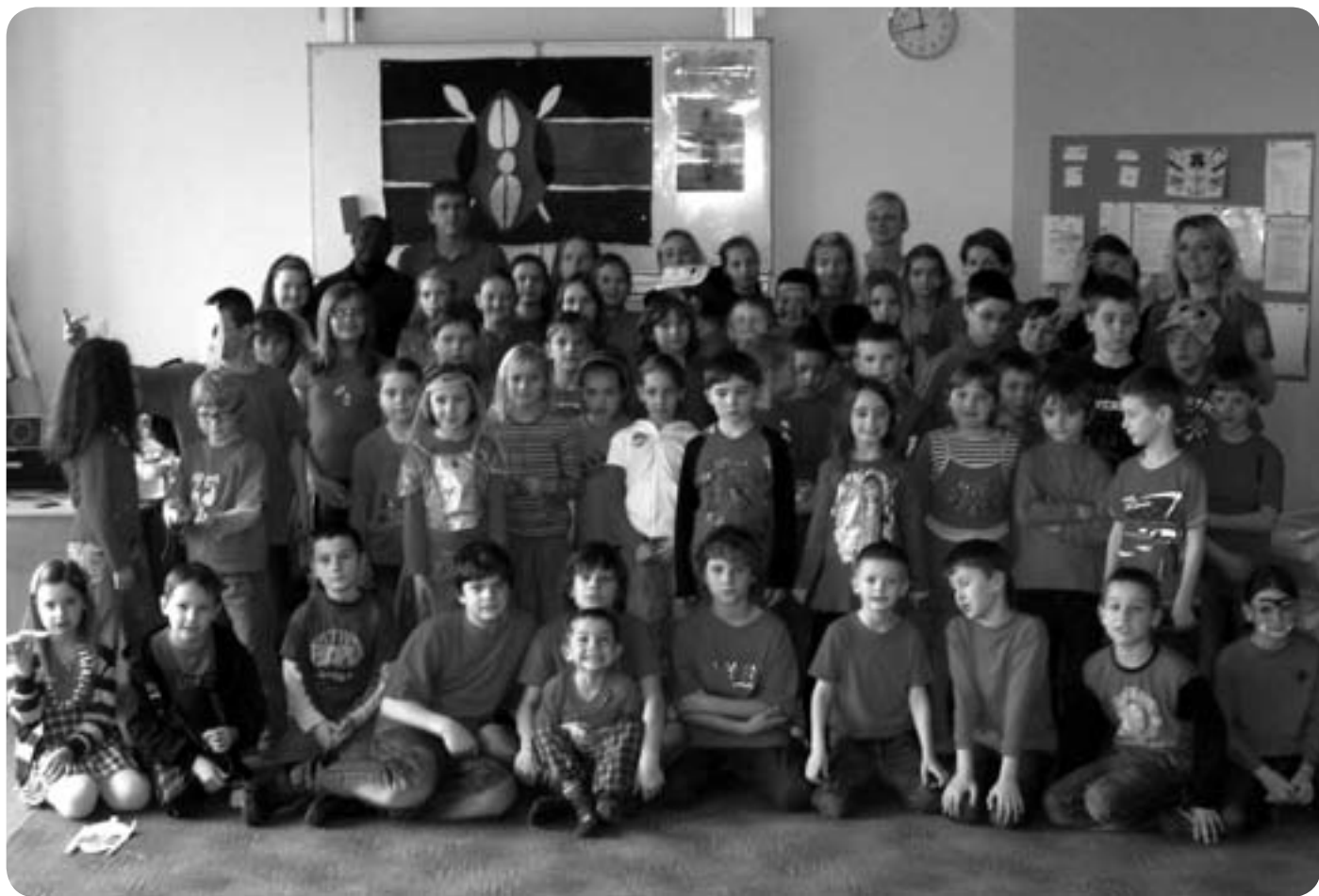
Afrika nevšedníma očima